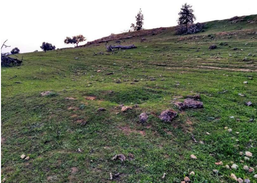
Figura 11. Túmulo de la Primera Edad del Hierro. En la zona central del túmulo aparece un hundimiento del terreno a modo de cráter consecuencia de haber sido excavado y expoliado en el pasado.

Se ubica en la primera terraza en su lado Este, justo al lado de la segunda terraza, a los 37° 23'49.703'' N, y 5° 42'22.192'' O 14 . Tiene un diámetro aproximado de unos 8 metros y una altura de escasamente 0,50 metros. En el pasado debió alcanzar una mayor envergadura y altura, si bien las labores agrícolas, la erosión y la sedimentación lo han reducido considerablemente. En efecto, en la antigüedad su alzado y visibilidad debió ser notable. Ello debió llamar la atención hasta el punto de que en el pasado, quizás en fechas tempranas, fue excavado y expoliado.