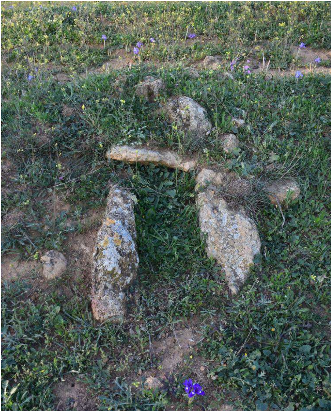
Figura 1. Se muestra una tumba protohistórica ejecutada con piedras planas