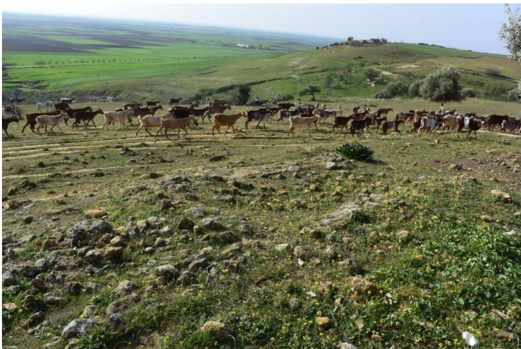
Figura 13. Se observa en el centro de imagen la planta rectangular del edificio funerario. Y en el lado inferior izquierdo la planta cuadrada de otro edificio funerario adosado al primero.

Está construido sobre una plataforma de bloques de piedras escalonada a modo de base o pedestal que mide unos 5 metros a todo lo largo del lado Sur del monumento. Esta plataforma forma una escalinata exterior de dos escalones perfectamente visibles, con una profundidad cada uno de ellos de 60 cm, a continuación de los cuales se elevan los muros.