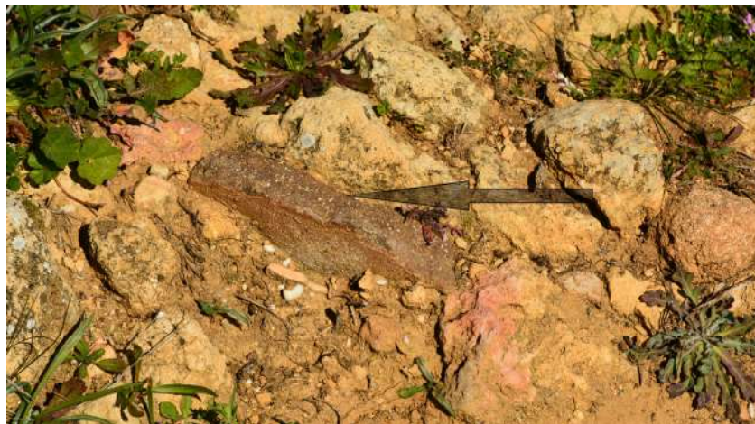
Figura 6 Cerámica indígena tosca y de baja cocción con desgrasante. Incrustada en mampostería de piedras calcáreas