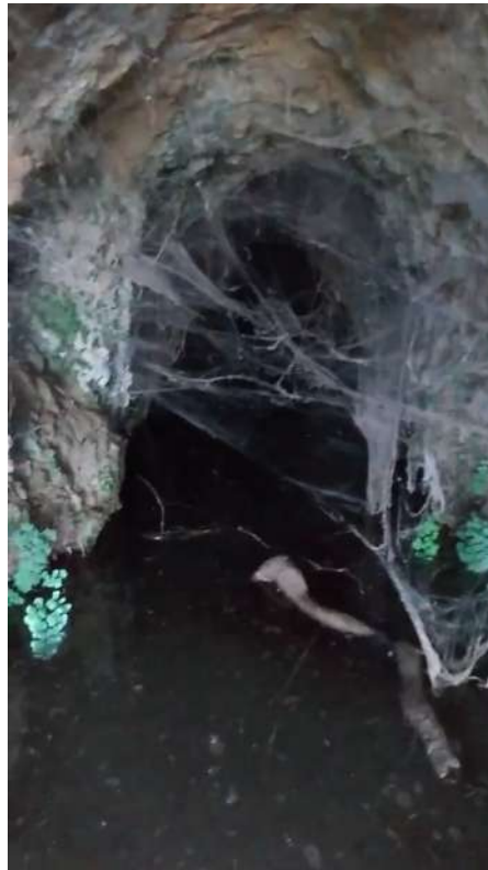
Figura 4 Mina de Agua. Falda Sur Puerto Alunada

Asimismo, en el lado Este también se alza una especie de pequeño promontorio rectangular con restos de mampostería de piedra y de téglulas formando la planta de lo que también fue un edificio funerario romano de época temprana.