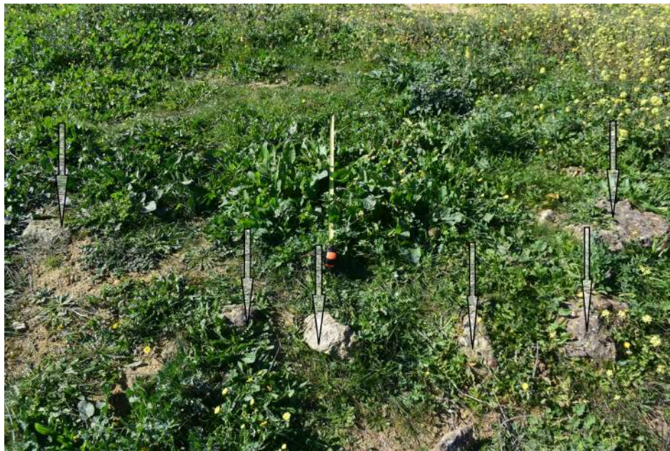
Figura 12. En el centro se observa ampliado el cráter dejado en la cima del túmulo totalmente colonizado por la vegetación, así como los bloques de piedras planas sacados de su interior y arrojados y desplegados alrededor de dicho cráter.

El hecho objetivo de la existencia de piedras planas arrojadas y desplegadas alrededor del cráter de excavación nos sugiere sin sombra de duda que se trataba de un túmulo con cavidad o habitáculo para inhumación que fue ejecutado y cubierto con dichas piedras planas por encima de las cuales se elevaba el túmulo.