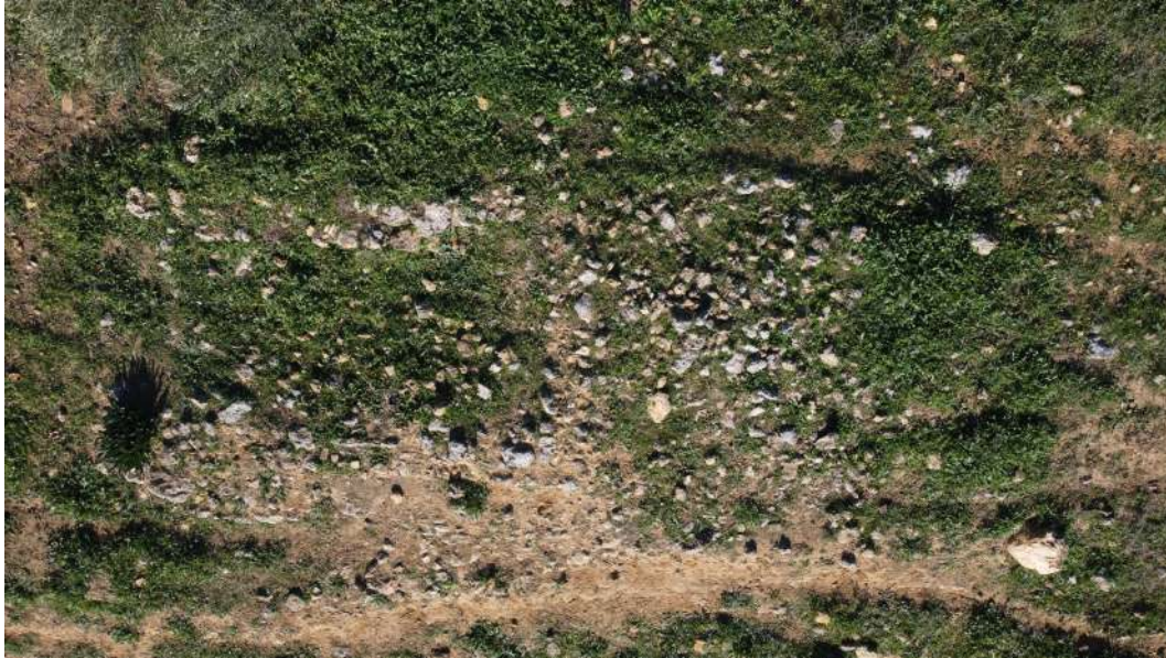
Figura 18 Fotografía de dron. Se visualizan dos estructuras totalmente estancas e independientes: una a la izquierda de planta rectangular -Oeste-; y otra de planta cuadrada a la derecha -Este-, adosada al muro Este de la primera.

Todos los elementos descritos (la plataforma a modo de base sobre la que se elevan los muros, la escalinata de acceso, la construcción que se eleva y sus reducidas dimensiones y disposición, las tégulas, etc.), así como el carácter sacro y funerario del emplazamiento, y teniendo presente los paralelos romanos en recintos funerarios, nos indican con una ponderada seguridad que estamos ante un monumento funerario, un mausoleo romano.