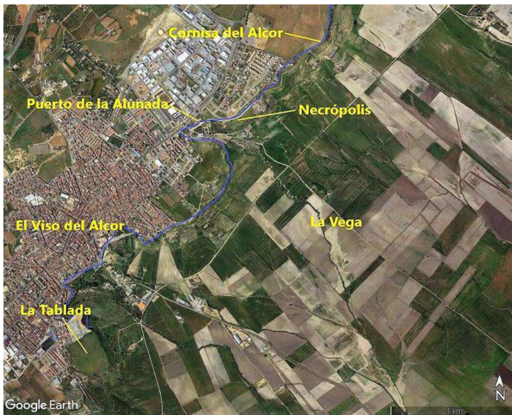
Figura 2. Fotografía satélite del área del yacimiento