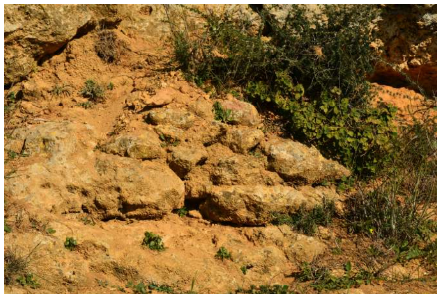
Figura 7 Fondo estructura funeraria realizada con mampostería de piedras del Alcor