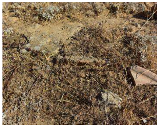
Figuras 15 y 16. En la primera fotografía se muestra enclavada una piedra tallada con forma cuadrada y con una hendidura circular en el centro. En la segunda, justo en su centro, aparece una tégula romana incrustada en el suelo y resto de otra a su derecha.

Entrando al interior, a la izquierda y justo unido al lado Oeste, se vislumbra a flor de tierra una plataforma de piedra o bancada que discurre a lo largo de parte de ese lado y que probablemente sirviera de plataforma de apoyo o banco.