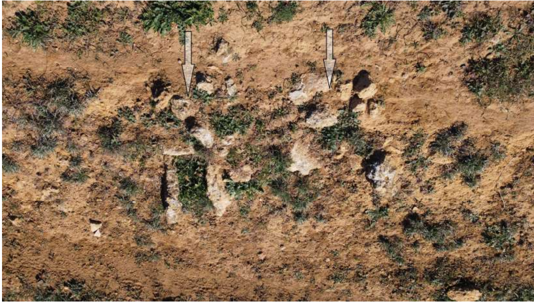
Figura 9 Fotografía de dron. Parte superior de dos estructuras funerarias

Puede observarse claramente que junto a esta tumba aparece una segunda similar, perfectamente alineada con la primera en la misma línea de la ladera del Alcor y a la misma altura. Ambas presentan características similares destacando sobre el terreno el grupo de piedras que conforman y fijan la estructura funeraria en su parte superior que asoma sobre el terreno, lo que puede divisarse perfectamente con la fotografía de dron.