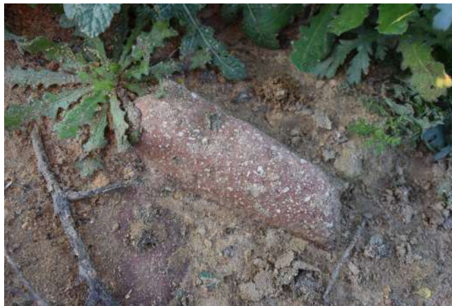
Figura 5 Cerámica indígena tosca de baja cocción con desgrasante. Incrustada en tierra