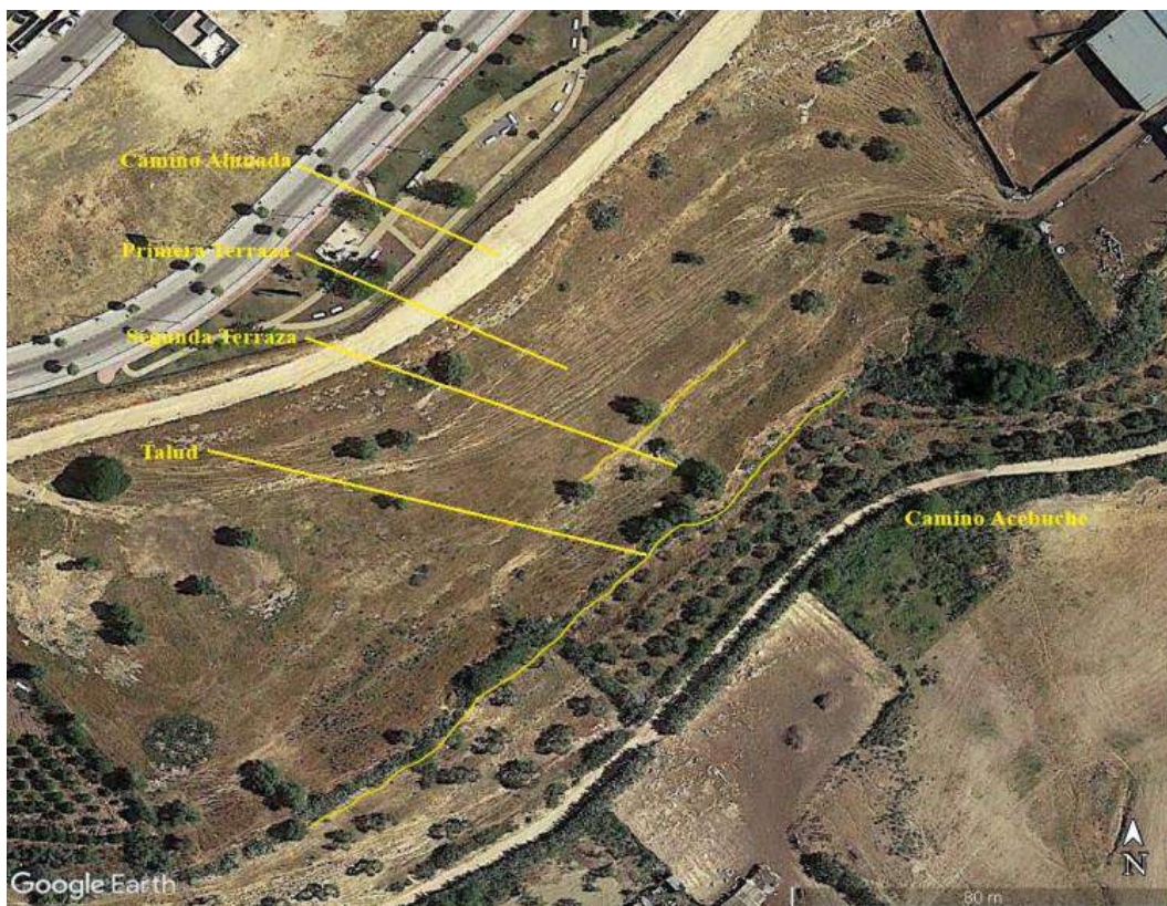
Figura 3 Vista satélite de la necrópolis. Falda Norte Puerto Alunada

A simple vista, llama la atención la gran cantidad de cerámica indígena tosca y de baja cocción que puede encontrarse en todo el yacimiento, siendo más abundante en la segunda terraza junto al talud. En esta cerámica pueden observarse las partículas blanquecinas, a veces doradas y brillantes, consecuencia de haber añadido a la arcilla un desgrasante de origen mineral que tras su cocción produce dicho efecto.