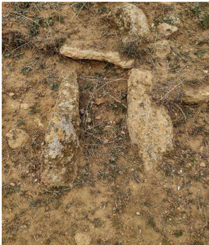
Figura 8. Se muestra en periodo estival sin la mayor parte de su corteza vegetal

Su tipología, la disposición de las piedras enmarcando un hueco o cavidad, se asemeja a otras tumbas de la Protohistoria, entre las que destacamos las tumbas de la necrópolis fenicia de Frigiliana en Málaga que aparecen en hoyo entibado completamente con piedras planas formando una estructura como la cista. 11 Otro paralelo se encontraría en alguna de las tumbas tartésicas de la necrópolis de La Joya en Huelva, la Tumba 3 que aparece en hoyo entibado y enmarcado con lajas de piedras. 12