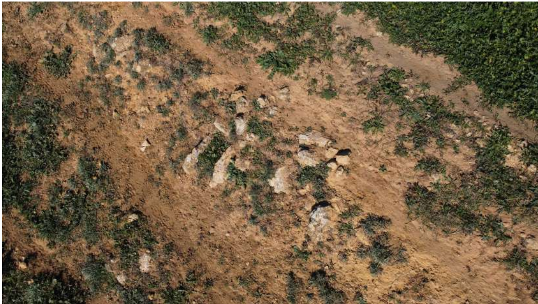
Figura 10 Fotografía de dron. Vista sesgada parte superior de dos estructuras funerarias